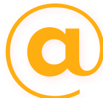
Это тоже собака.